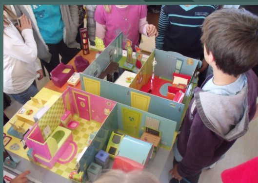
Outil pédagogique "Justin Peu d'Air"

Le CPIE anime pour l'Agence Régionale de Santé un programme de prévention des risques pour la santé liés à la qualité de l'air intérieur. Une dizaine de séances de sensibilisation se sont déroulées entre septembre et décembre 2016 auprès de divers publics, aussi bien enfants en classe primaire, lycéens qu'assistantes maternelles.