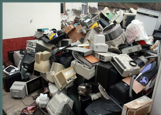
Les déchets électroniques