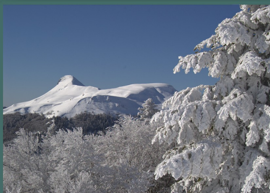
Haute vallée de la Cère

Le milieu montagnard est depuis de nombreuses années l'un des terrains d'étude favori de l'équipe du CPIE. C'est donc tout naturellement que nous proposons une découverte hivernale de la montagne, raquettes à neige aux pieds. Ce mode de déplacement bien adapté à une approche discrète de la nature en favorise la découverte : traces de vie animale ou paysages insolites. Plusieurs écoles du département sont déjà inscrites pour participer cet hiver à une sortie à la demi-journée, guidée par un accompagnateur en montagne diplômé d'Etat. Si vous faites partie d'un groupe intéressé par cette activité (amis, collègues, association) contactez nous au 0471484909.