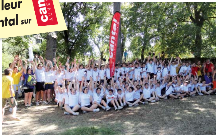
80 collégiens cantaliens (encadrés par les lycéens) lors de l'arrivée du PéléVTT à Rocamadour