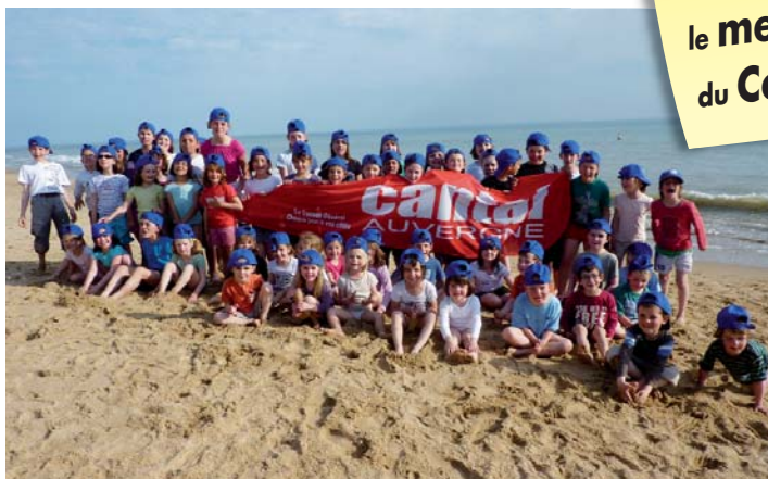
L'école de Giou de Mamou en classe de mer à La Rochelle

NOUVEAU ! Retrouvez le meilleur du Cantal sur cantal AUVERGNE