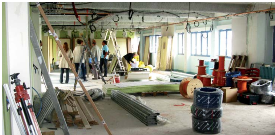
Les travaux avancent à Mauriac

Le programme de rénovation porte sur les points suivants : la mise en sécurité générale du bâtiment (désenfumage, isolement coupe-feu, rénovation des installations électriques, de plomberie et d'alarme d'incendie), le déplacement de l'internat avec création de locaux entièrement neufs, le repositionnement de la Section d'Enseignement Général et Professionnel Adapté (SEGPA) au sein du bâtiment principal, le déplacement et le réaménagement du CDI, la création d'un préau, la construction d'un ascenseur assurant la desserte de tous les étages du bâtiment.