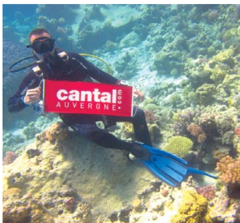
La Marque Rouge en Mer Rouge sur fond de jardin de corail...