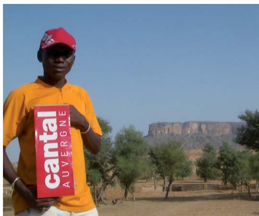
...au Mali en pays Dogon...