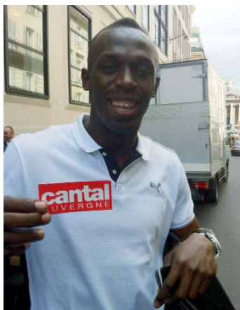
Hussein Bolt : l'homme le plus rapide du monde rattrapé par la Marque Rouge