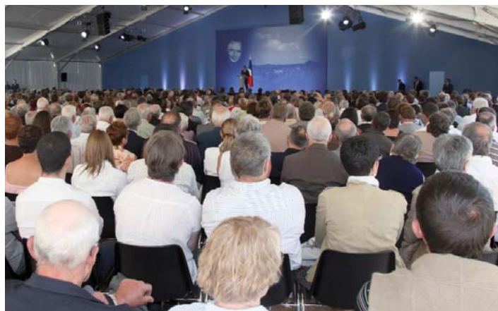
Le Président Nicolas Sarkozy rend hommage au Président Georges Pompidou dans le Cantal