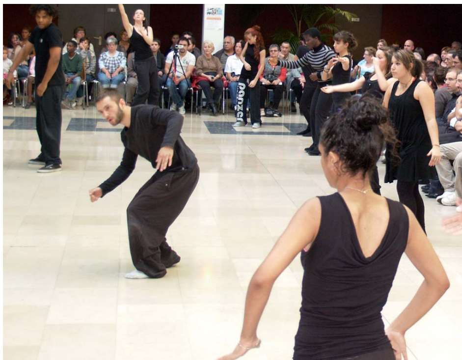
La Manufacture - JDH 2010

“L’identité n’est pas l’identique : osons les différences”, tel est le thème de la 4 e Journée du Handicap qui s’ouvrira à Mauriac le 8 octobre et se poursuivra à l’Hôtel du Département à Aurillac le 15 octobre.