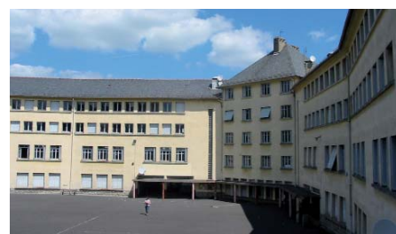
Collège Georges Bataille à Riom-ès-Montagnes