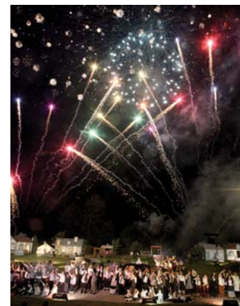
« Les Gens d'Ici » à Jussac, encore une belle édition