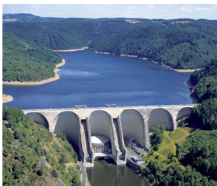
Le barrage de Grandval (bassin Lot/Truyère)

(1) Grandval, Lanau, Enchanet, Saint-Étienne Cantalès, Nèpes, Auzerette et L'Aigle.