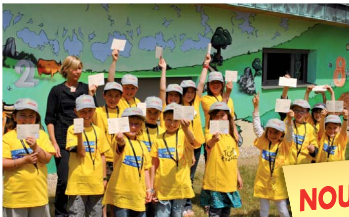
Les élèves de la classe de CE2 de Crandelles obtiennent leur permis piéton avec la gendarmerie