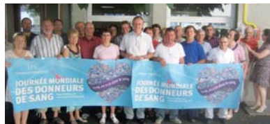
les Présidents des 24 associations du Cantal mobilisés pour la Journée Mondiale des Donneurs de Sang 2011.

L'union départementale des donneurs bénévoles du Cantal compte 24 associations avec 250 bénévoles. Plus de 6000 donneurs dans le Cantal en font l'un des départements les plus généreux. Le Conseil Général est le 1 er partenaire de l'union.