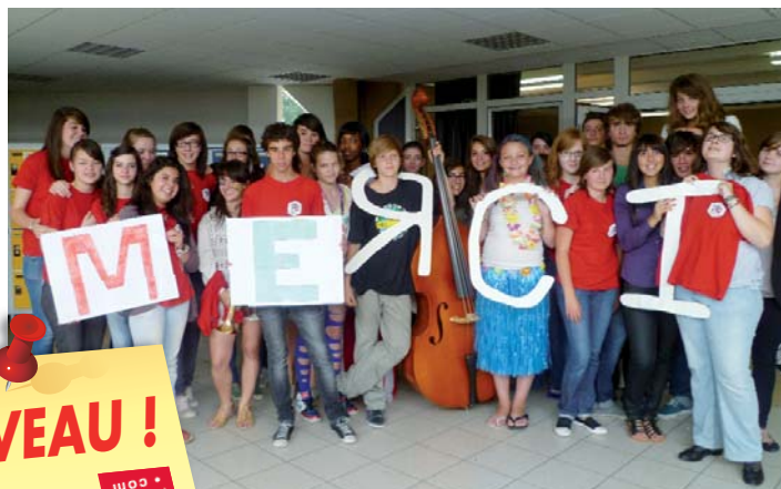
Les élèves du Cantal solidaires de Lorca (Espagne)

NOUVEAU ! Retrouvez le meilleur du Cantal sur cantal AUVERGNE