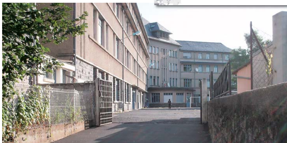
Collège Le Méridien à Mauriac

D'autres travaux importants sont en cours d'étude, dont la mise aux normes du collège Georges Bataille à Riom-ès-Montagnes pour laquelle le permis de construire vient d'être déposé. Les travaux devraient démarrer en 2012.