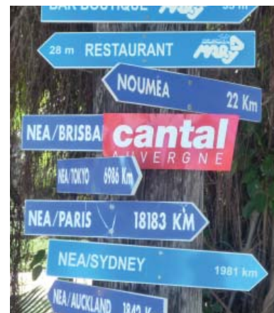
...et à la croisée des chemins en Nouvelle-Calédonie