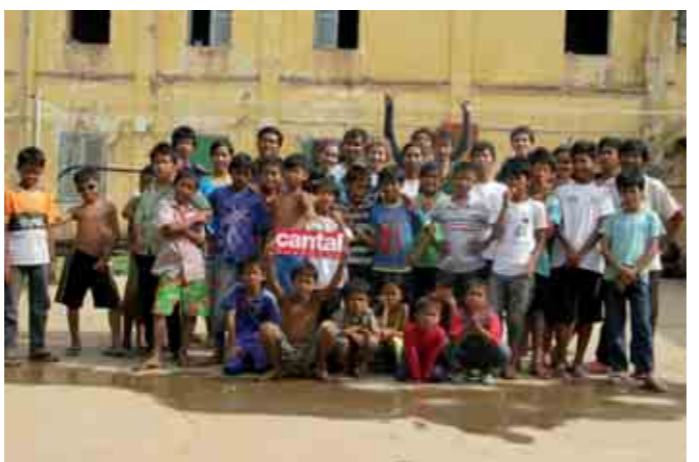
Scouts et guides de France lors de leur projet au Cambodge