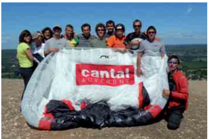
Les parapentistes du Rid'Air Team Cantal en compétition !