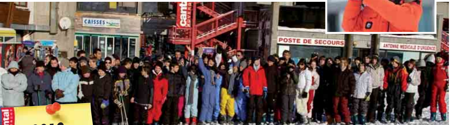
Grâce au Conseil Général, 1400 collégiens découvrent la station du Lioran

2010 Envoyez vos photos, le jeu continue sur cantal.com