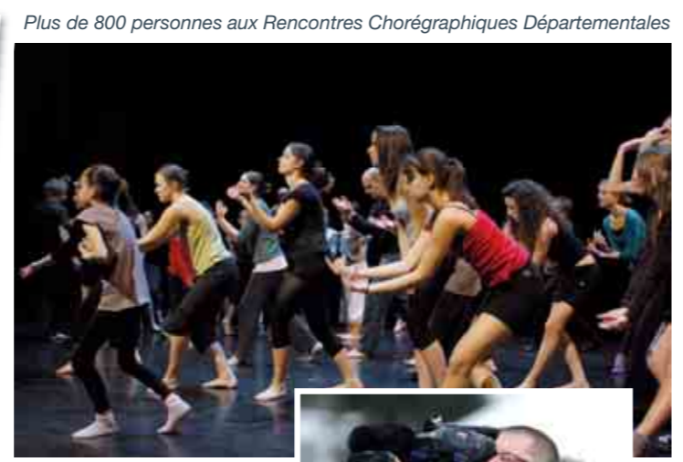
Plus de 800 personnes aux Rencontres Chorégraphiques Départementales