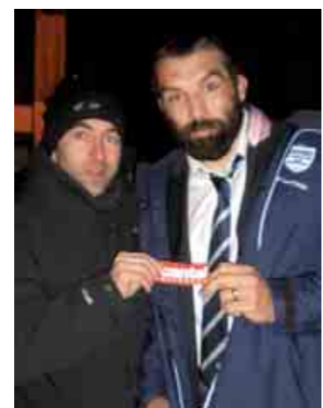
Quand Chabal rime avec Cantal !