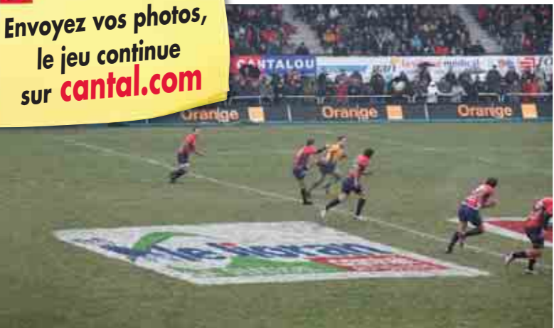
Devant les caméras de Sport+, Le Lioran, témoin de la victoire du Stade Aurillacois contre Agen

2010 Envoyez vos photos, le jeu continue sur cantal.com