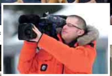
Les caméras des TV nationales de plus en plus présentes dans le Cantal...