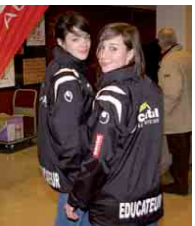
Les éducateurs des clubs de sport cantaliens équipés par le Conseil Général